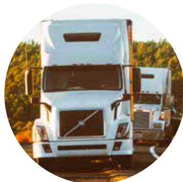
Flotillas de camiones