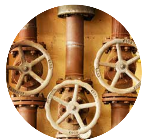
Limpieza de tuberías